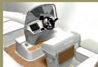
AIR CONSOLE + BOLSTER

CES 3 NOUVEAUX N-ZO SEMI-RIGIDES BÉNÉFICIENT D'INNOVATIONS SUR LA CARÈNE ET SUR LE PONT.