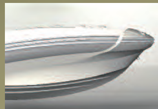
CARÈNE EN V PROFOND