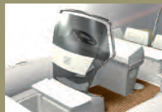
AIR CONSOLE (N-ZO 600/N-ZO 680)